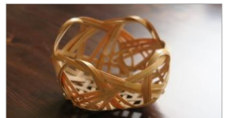
講師: 箆屋 鈴木

日 時 : 令和6年3月10日 (土) 午前の部 9:30~12:00 午後の部 13:30~16:00 参加費 : 2,500円 定員 : 12名 (6名/各回) 内 容 : 初心者でもOK。四つ目編みの籠を作ります(約15cm)。 募集開始日: 2月14日 (水)