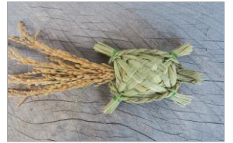
講師: わら細工 島、都築

日 時 : 令和6年1月13日 (土) 10:00~12:00 参加費 : 1,700円 定員 : 12名 内 容 : わらと5円玉を使い、小さな亀の部屋飾りを作ります。 募集開始日: 12月13日 (水)