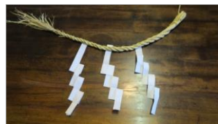
講師：わら細工 島、都築