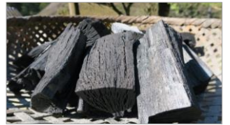
講師: 炭焼き 大堀

日 時 : 令和6年1月20日 (土)、28日 (土) 10:00~12:00 ※2日間にかけて開講します 参加費 : 2,200円 定員 : 12名 内 容 : 伝統的な炭作りを、講師指導の下で体験することが出来ます。 募集開始日: 12月20日 (水) ※12月23日~翌1月2日は閉館日のためご応募いただけません。