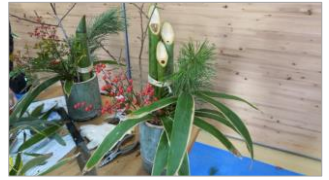
講師: 箆屋 野村

日 時 : 令和5年12月16日 (土) 9:30~12:30 参加費 : 2,200円 定員 : 12名 内 容 : 手作りの卓上門松で新年を飾りましょう。 募集開始日: 10月25日 (水)