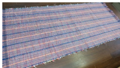
講師 : 機織り 梶、宮迫

日時 : 令和3年2月14日(日) 9:00~11:00 参加費 : 1,700円 定員 : 4名 内容 : 裂かれた布を織っていき、テーブルセンターを作ります。 募集開始日: 1月11日(月)