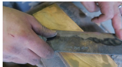
講師 : 鍛冶屋 広瀬、松本

日時 : 令和2年9月20日(日) 9:00~11:00 参加費 : 4,000円 定員 : 12名 内容 : 包丁の砥ぎ方等、包丁を扱う上での基礎知識をお教えます。 募集開始日: 8月10日(月)