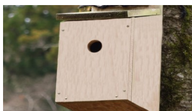
講師 :笹屋 野村