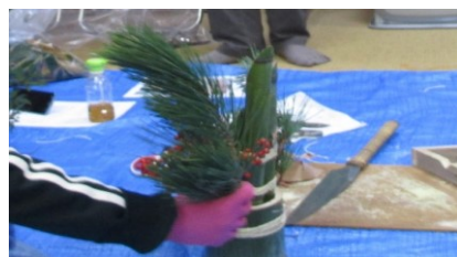
講師 : 箆屋 野村

日時 : 令和2年12月20日(日) 9:00~12:00 参加費 : 1,700円 定員 : 12名 内容 : 本物の竹や梅から門松を作り、美しい新年を飾りましょう! 募集開始日: 12月8日(火)