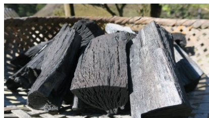
講師 : 炭焼き 大堀

日時 : 令和3年1月23日(土)、30日 9:00~11:00 ※2日にかけて開講します 参加費 : 1,700円 定員 : 12名 内容 : 伝統的な炭作りを、講師指導の下で体験することができます。 募集開始日: 12月8日(火)