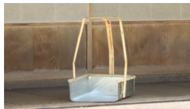
講師 :笹屋 野村