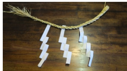
講師 : わら細工 島、都築

日時 : 令和2年12月13日(日) 10:00~12:00 参加費 : 1,200円 定員 : 12名 内容 : 自らの手でしめ縄を作り、新年を迎えましょう! 募集開始日: 11月9日(日)