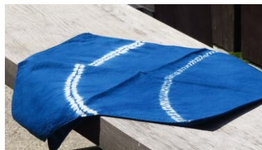
講師 :紺屋 小野田、河合